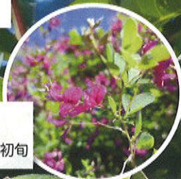
ハギ 8月中旬～9月初旬