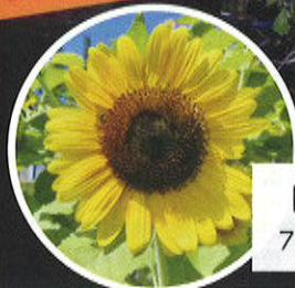
ヒマワリ 7月下旬～8月