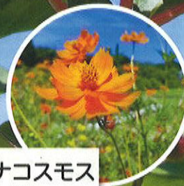
キバナコスモス 9月

HIBIYA-KADAN 大船フラワーセンター 〒247-0072 神奈川県鎌倉市岡本1018 Tel.0467-46-2188 Fax.0467-46-2486 https://www.fcofuna-kanagawa.jp/