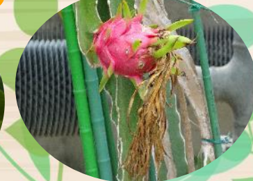
N ドラゴンフルーツ