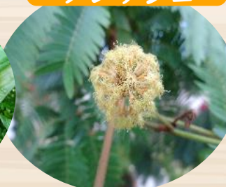
A エバー フレッシュ