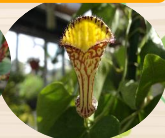
O アリストロキア トリアンブラシス