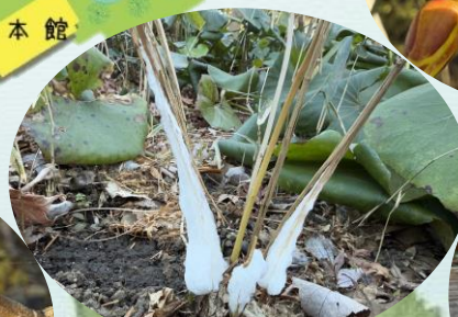
B シモバシラ (寒い日の朝限定)