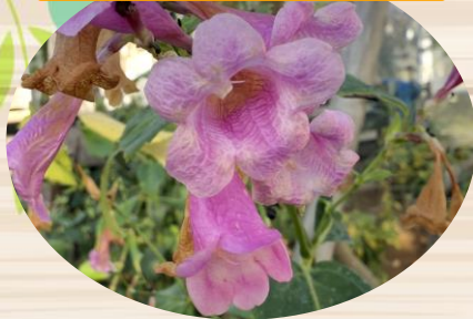
E フリワケサンゴバナ