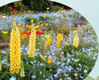
O 花壇 ネモフィラ, ルピナス, キンセンカ など