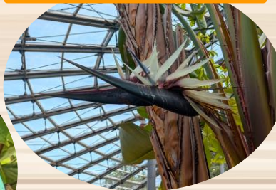
I ストレリチアアルバ