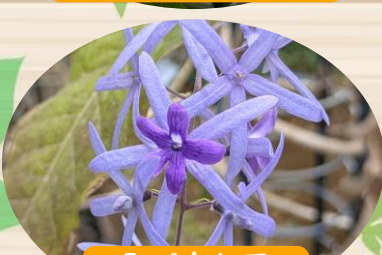
E ペトレア ウォルビリス