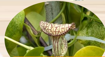
L アリストロキア・ トリアングラリス