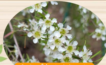
Q レプトスペルマム フラベスケンス