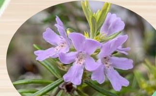
N ウエストリンギア