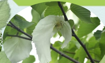
D ハンカチノキ(終盤)