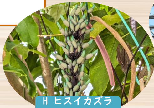
H ヒスイカズラ (つぼみ)