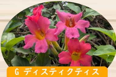
G ディスティクティス ブッキナトリア