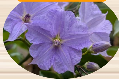
I ソラナム ウエンドランディー