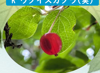
K ウグイスカグラ(実)