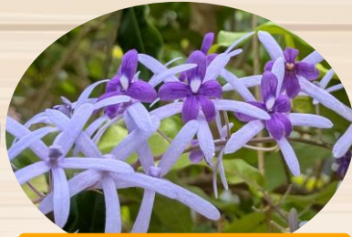
F ペトレア ウォルビリス