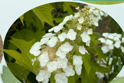
B カシワバアジサイ