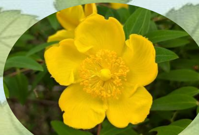
E ヒペリクム ヒドコート