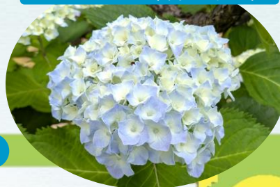
M アジサイ(咲き始め)