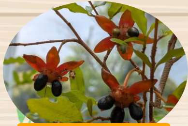
B オクナ セルラタ