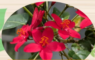
E ほこばヤトロファ