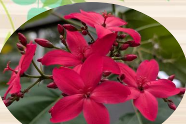
D ほこばヤトロファ