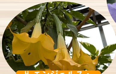
H エンジェルス・ トランペット