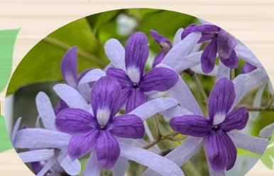
E ペトレア ウォルビルス