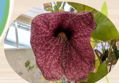
M アリストロキア・ ギガンティア