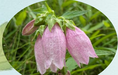
F ヤマホタルブクロ