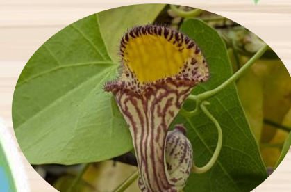
L アリストロキア・ トリアングラリス