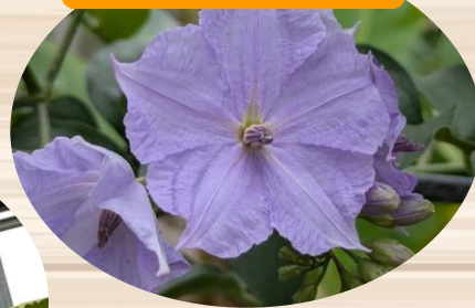
I ソラヌム ウエン ドランディー