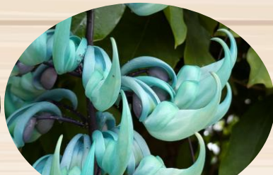
F ヒスイカズラ(終盤)