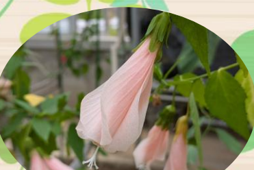
A ウナズキヒメフヨウ