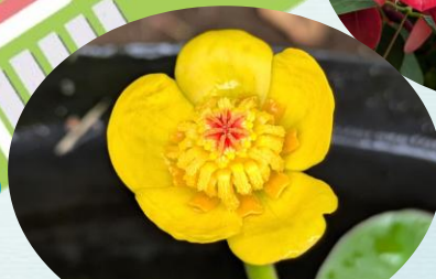
P サイゴクヒメコウホネ