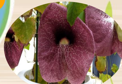
M アリストロキア・ ギガンティア