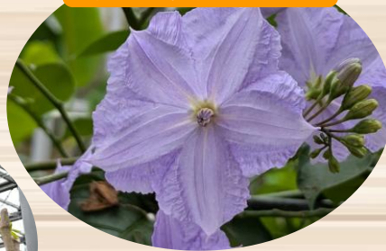
I ソラヌム ウエンドランディー