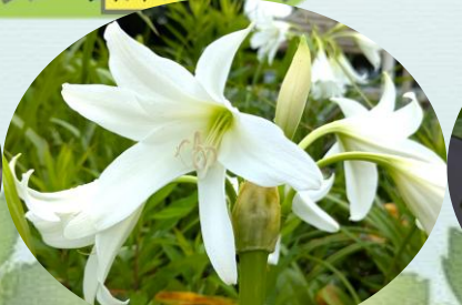
C クリナム・パウエリー