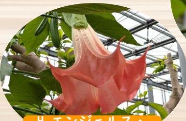
H エンジェルス・ トランペット