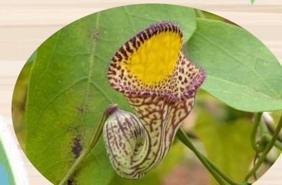
L アリストロキア・ トリアングラリス