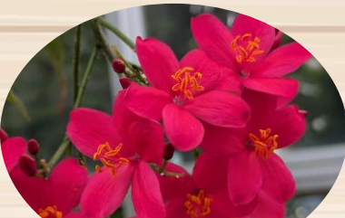
F ほこばヤトロファ