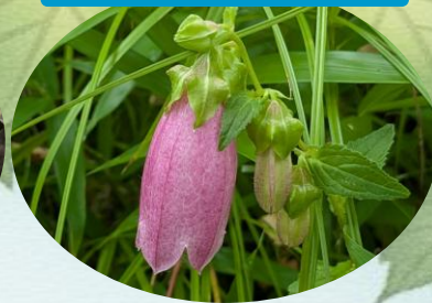
K ヤマホタルブクロ