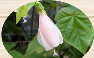
C ウナズキヒメフヨウ