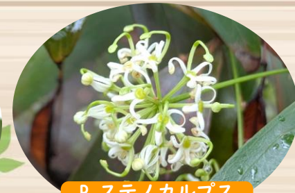
P ステノカルプス サリグヌス