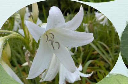
B クリナム・パウエリー