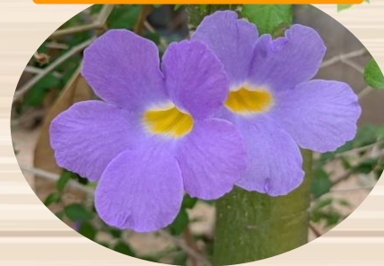
J コダチャハズカズラ