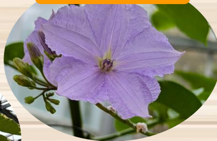
I ソラヌム ウエンドランディー