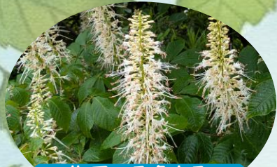
H アエスクルス パルウィフローラ