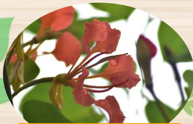
E ベニバナソシンカ