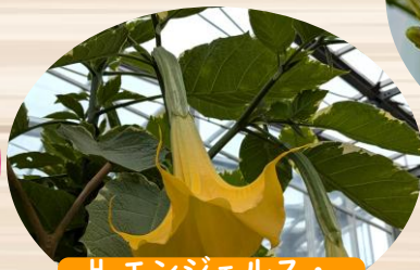
H エンジェルズ・ トランペット