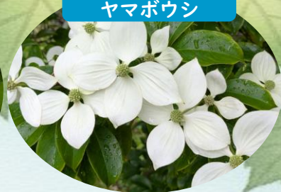
K ジョウリヨク ヤマボウシ