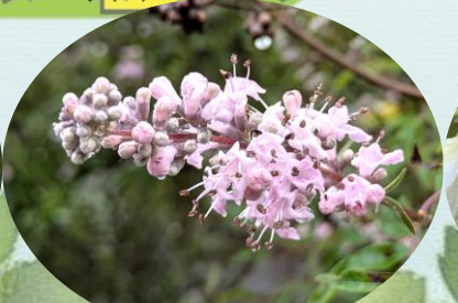
C セイヨウニンジンボク