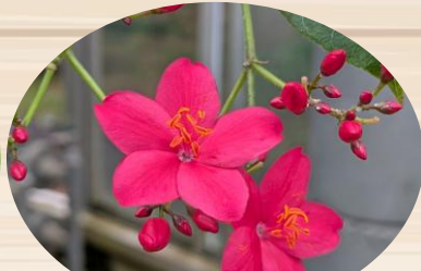
F ほこばヤトロファ