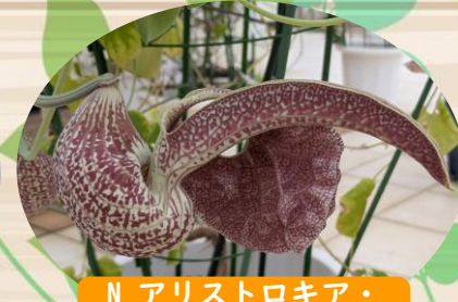
N アリストロキア・ ブラジリエンセ