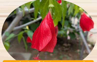
C ウナズキヒメフヨウ